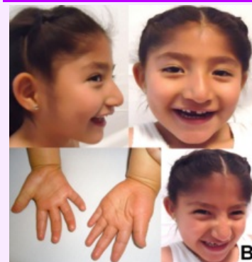
pětiletá dívka z Mexika s Angelmanovým syndromem