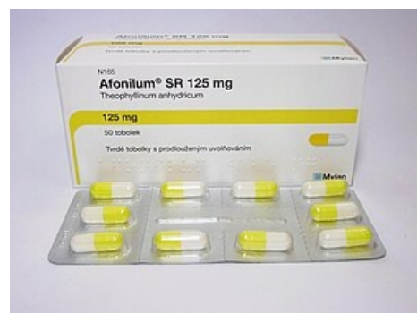
Theofylin k perorálnímu použití