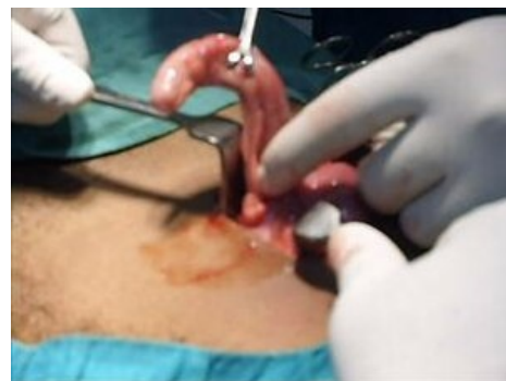
chirurgický zákrok zánětlivého appendixu

Vyšetření per rectum je neodmyslitelnou součástí diagnostiky u NPB. Nález krve nebo hleny ve stolici nám často pomůže k diagnóze. Také palpce Douglasova prostoru, který může být vyklenutý a bolestivý pod tlakem hromadící se krve nebo jiné tekutiny, mnohé napoví. U dětí s akutně probíhajícím zánětem v oblasti malé pánve posuzujeme také napětí análního svěrače.