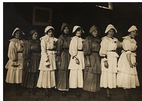
Zdravotní sestry během 1. světové války