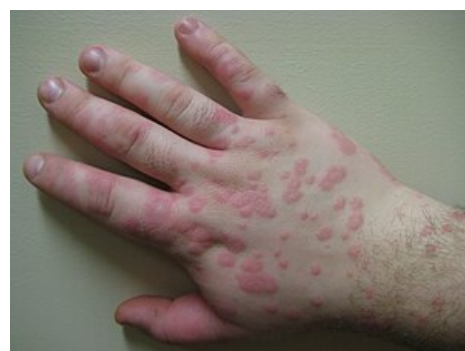
Erythema exsudativum minus

Medscape 1122915 ( https://emedicine.medscape.com/article/1122915-overview )