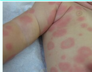
Kojenecká kožní vyrážka