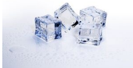
Led - pevné skupenství