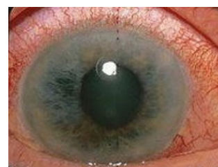
Akutní záchvat glaukomu