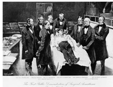
16. október 1846, Boston – prvá operácia, pri ktorej bola demonštrovaná éterová narkóza