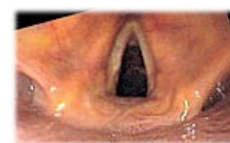
Fotografie rima glottidis

Rima glottidis mění svou šíři a napětí okrajů vlivem svalů hrtanu, které ovládají pohyby hrtanových chrupavek. Rozechvěním plicae vocales proudem vzduchu za výdechu vzniká ve štěrbině zvuk , který pak resonancí v dutinách výše uložených (hrtan, hltan, ústní dutina, nosní dutina, vedlejší dutiny nosní) získává barvu lidského hlasu. Rozdíly ve stavbě hrtanu muže a ženy podmiňují rozdíly ve výšce hlasu. Hlasové vazy muže mají 24–25 mm, hrtan je celkově prostornější. Proto mají muži přibližně o oktávu nižší hlas než ženy. Délka ženských hlasivkových vazů je okolo 20 mm.