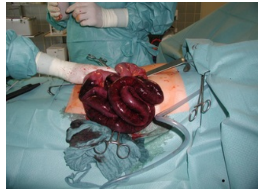
Chirurgická léčba ileu