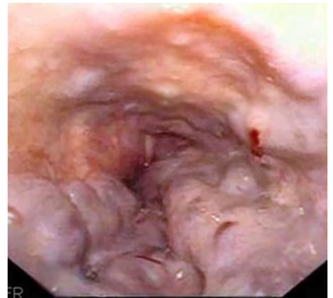
Endoskopie – krvácení z jícnových varixů

Problematika zavádění TIPSu je rozšířena o kvalitu parenchymu jater v místě výkonu. Jícnové varixy se většinou vyskytují u pacientů s pokročilými cirhotickými změnami jater. Kvalita jaterní tkáně proto není ideální. To sebou nese rizika jak peroperačně tak v období po výkonu (zhoršené hojení, krvácení...).