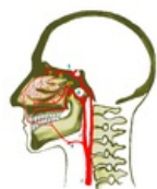
Nos-cévy.png 2,048 × 2,048; 712 KB