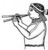
Tinnitus.jpg 163 × 168; 6 KB