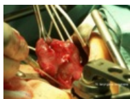
Operace štítné žl... 800 × 600; 872 KB