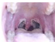
Tonzilektomie.jpg 800 × 600; 38 KB