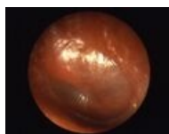
Otitis media acut... 754 × 600; 56 KB