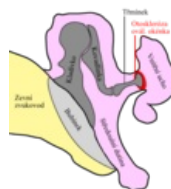
Otosklerose.png 314 × 348; 36 KB