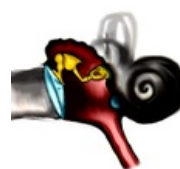
Středníucho.png 2,048 × 2,048; 1.97 MB