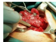
Monitoring n. lar... 800 × 600; 757 KB