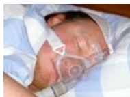
CPAP.jpg 1,600 × 1,200; 349 KB

The following 13 files are in this category, out of 13 total.