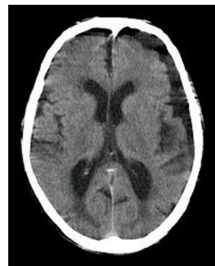
Subdurální hygrom frontálně a temporálně