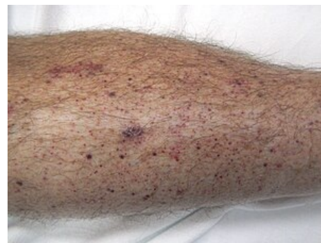
Petechie na dolní končetině (malé tečky)