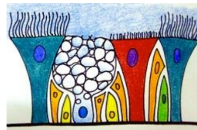
Víceřadý cylindrický epitel dýchacích cest