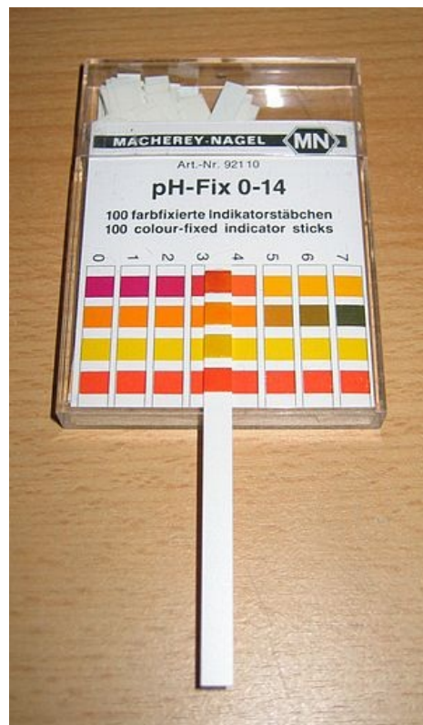
Indikátorový papírek pro orientační stanovení pH

Běžné pH-metry jsou elektronické voltmetry s velkým vnitřním odporem, které měří s přesností setin jednotek pH; citlivější přístroje mohou dosahovat přesnosti desetkrát větší, používají se k měření pH krve v klinicko-biochemických laboratořích.