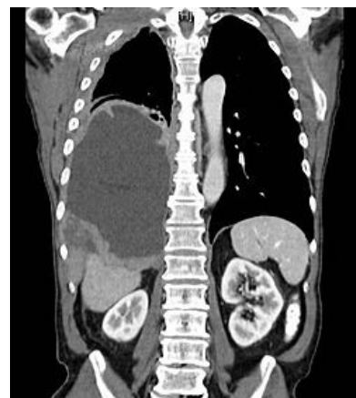
CT maligního mezoteliomu pravé plíce

Terapie: blokáce tvorby nukleotidů, Pemetrexed, Cis-platina