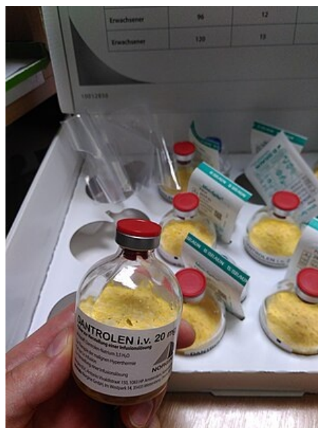
Dantrolen před naředěním v 20mg balení. Lék se užívá v léčbě maligní hypertermie.