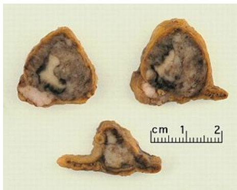
Metastáza do nadledviny