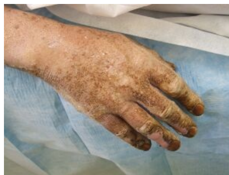
Popálenina ruky elektrickým obloukem - obr. 2