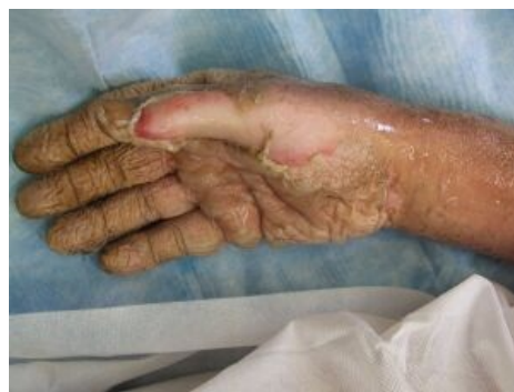
Popálenina ruky elektrickým obloukem - obr. 1