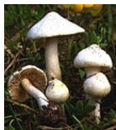
Inocybe geophylla – Vláknice zemní