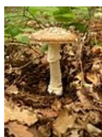
Amanita pantherina – Muchomůrka tygrovaná