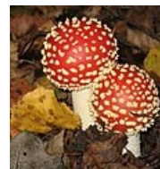
Amanita muscaria – Muchomůrka červená