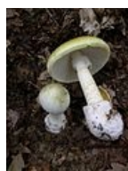
Amanita phalloides – Muchomůrka zelená