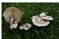
Clitocybe rivulosa – Strmělka potůčková