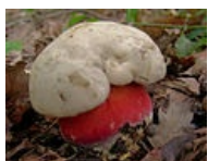
Boletus satanas – Hřib satan