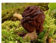
Gyromitra esculenta – ucháč obecný