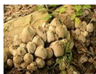
Coprinus atramentarius – Hnojník inkoustový