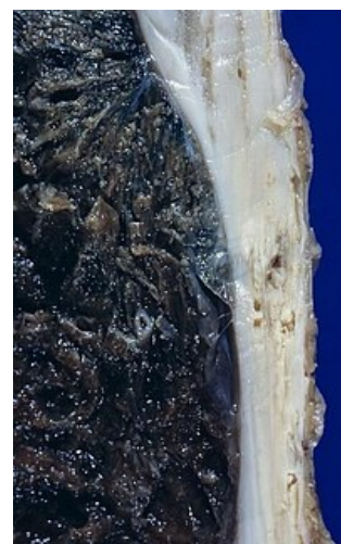
Ložiskové kalcifikace v terénu pleurální fibrózy