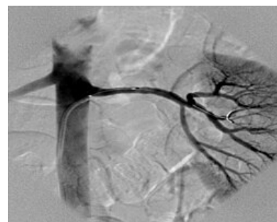
Selektivní angiografie a. renalis po proběhlé PTCA