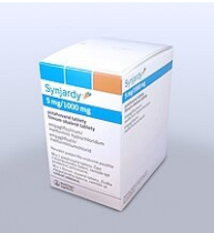
Empagliflozin v kombinaci s metforminem k perorálnímu použití