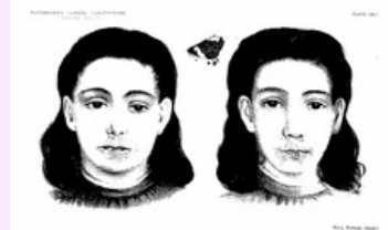
Příznaky Peutz-Jeghersova syndromu na obličeji a rtu