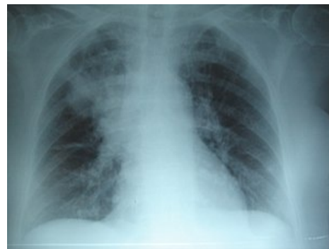
RTG vyšetření pacienta s pneumonií, patrný zánětlivý infiltrát.

Neexistují specifické symptomy, které by s určitostí umožnily pneumonii diagnostikovat. Pravděpodobnost diagnózy zvyšuje současná přítomnost výše uvedených projevů. Musíme brát v úvahu, že především mladší děti mají častěji nespecifické příznaky jako jsou letargie, zvracení, nevěle k přijímání potravy či fyzické aktivitě. [4]