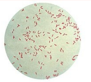
Pseudomonas aeruginosa – gramovo barvení