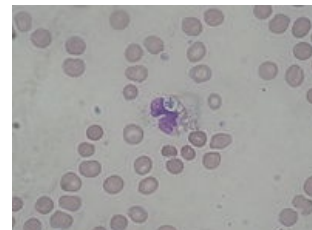
Fagocytóza Ps. aeruginosa neutrofilem u pacienta s infekcí v krevním řečišti