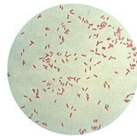
Pseudomonas aeruginosa – gramovo barvení