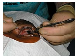
Chirurgické odstránení pterygia