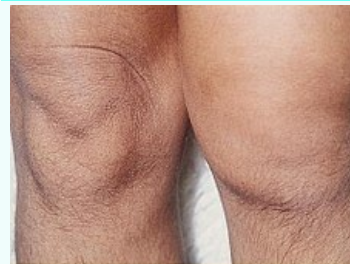
Reaktivní artritida kolen