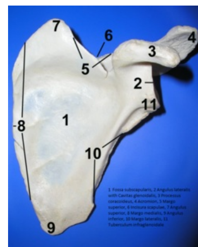
Lopatka z přední strany, s popisky