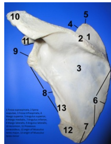
Lopatka zezadu, s popisky