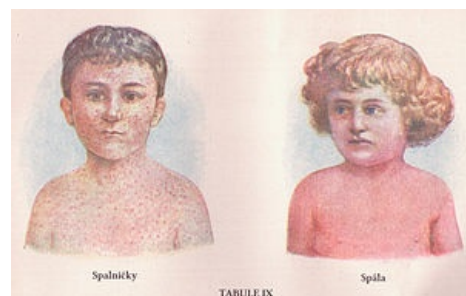
Spalničky vs. spála