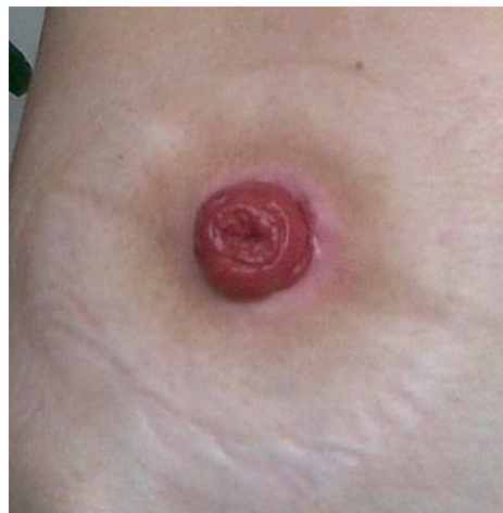
Vyústění tenkého střeva