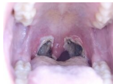
Pohled do dutiny ústní po provedené tonzilektomii

U neinfekční hypertrofie tonzil se diskutuje provedení radiofrekvenční ablace nebo tonzilotomie (parciální odstranění tonzily kličkou či laserem – nyní se již neprovádí , protože po ní dochází k masivnímu jizvení a k chronickému zánětu ve zbytku mandlí [1] ).