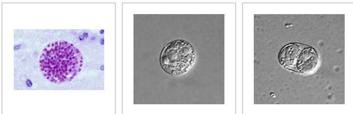
Tkáňová cysta s bradyzoity