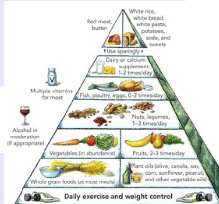
Potravinová pyramida Harvard School of Public Health