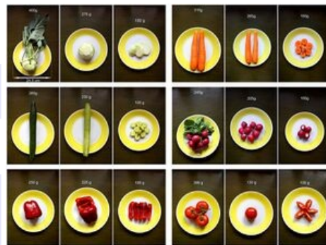
Jak vypadá 100g zeleniny