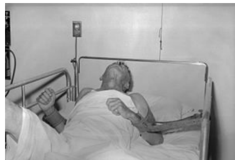
Pacient se vzteklinou