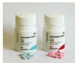
Léková forma warfarinu