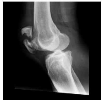
Dislokováná zlomenina patelly