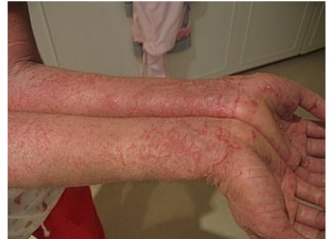
Klinický obraz atopického ekzému

Je to také jediná imunopatologická reakce, která se nevyskytuje u autoimunitních chorob . Jedinci s predispozicí reagovat na neškodné antigeny produkcí IgE jsou nazýváni atopici . Proto je tento druh přecitlivělosti někdy nazýván atopie .