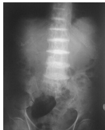
Kalcifikace intervertebrálních disků při alkaptonurii

nadměrné množství homogentisátu v organismu je způsobeno nefunkčním enzymem homogentisát dioxygenázou