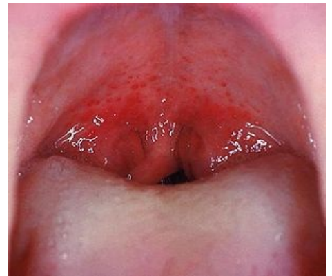
Petechie u streptokokové angíny