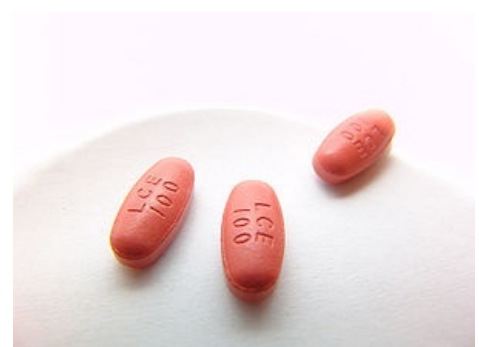
Stalevo® (kombinace: levodopa, karbidopa, entakapon)