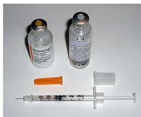
Inzulinka k subkutánní aplikaci inzulínu