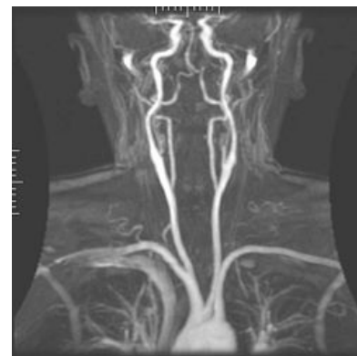
Angiografie magnetickou rezonancí