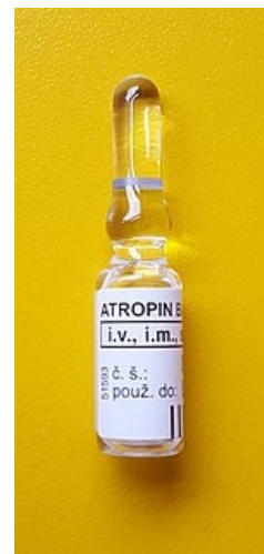
ampule 0,5mg/ml atropinu