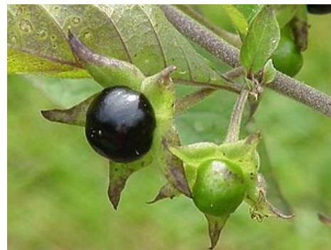
Rulík zlomocný roztahuje zorničky (belladonna)