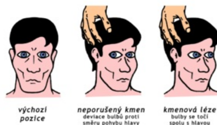
Okulocefalický reflex v bezvědomí

Držíme hlavu nemocného (na zádech), oči jsou upřeny na nos vyšetřujícího při natočení hlavy na stranu zůstávají oči zdravého fixovány