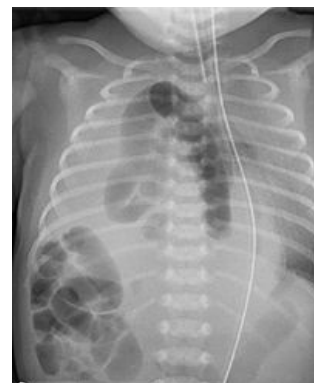
Pravostranná brániční kýla