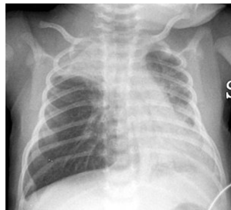
Hrudní RTG 16denního dítěte - výrazná hyperinflace plic s oploštěním bránice, bilaterální atelektázy v pravém plicním hrotu a v levé bazální oblasti.