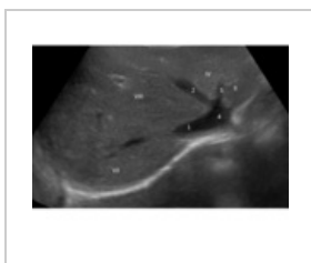
Játra, jaterní žíly (1, 2 a 3) a v. portae (4) při zobrazení ultrazvukem