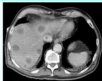
Buddův-Chiariho syndrom na CT vyšetření

Diagnostika fyzikální vyšetření, rozbor krve, ultrazvuk nebo CT