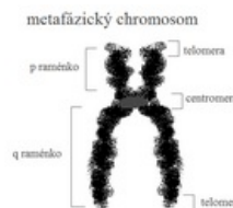
Morfologické schéma chromosomu.